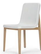
SEDAN CHAIR 2015