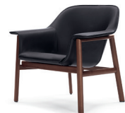
SEDAN LOUNGE CHAIR 2013