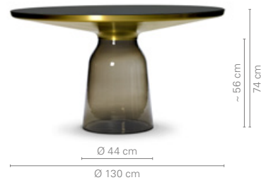
Table. Hand-blown glass base in smoke grey. Metal top frame solid brass with clear varnish. Tabletop crystal glass, black lacquered or tabletop marble Nero Marquina or Bianco Carrara, polished and impregnated or matt polished with colour-enhancing impregnation.

Tisch. Mundgeblasener Glasfuß in Rauchgrau. Metallaufsatz aus massivem Messing, klar lackiert. Tischplatte aus Kristallglas, schwarz lackiert oder Tischplatte aus Marmor Nero Marquina oder Bianco Carrara, poliert und imprägniert oder matt geschliffen und farbvertiefend imprägniert.