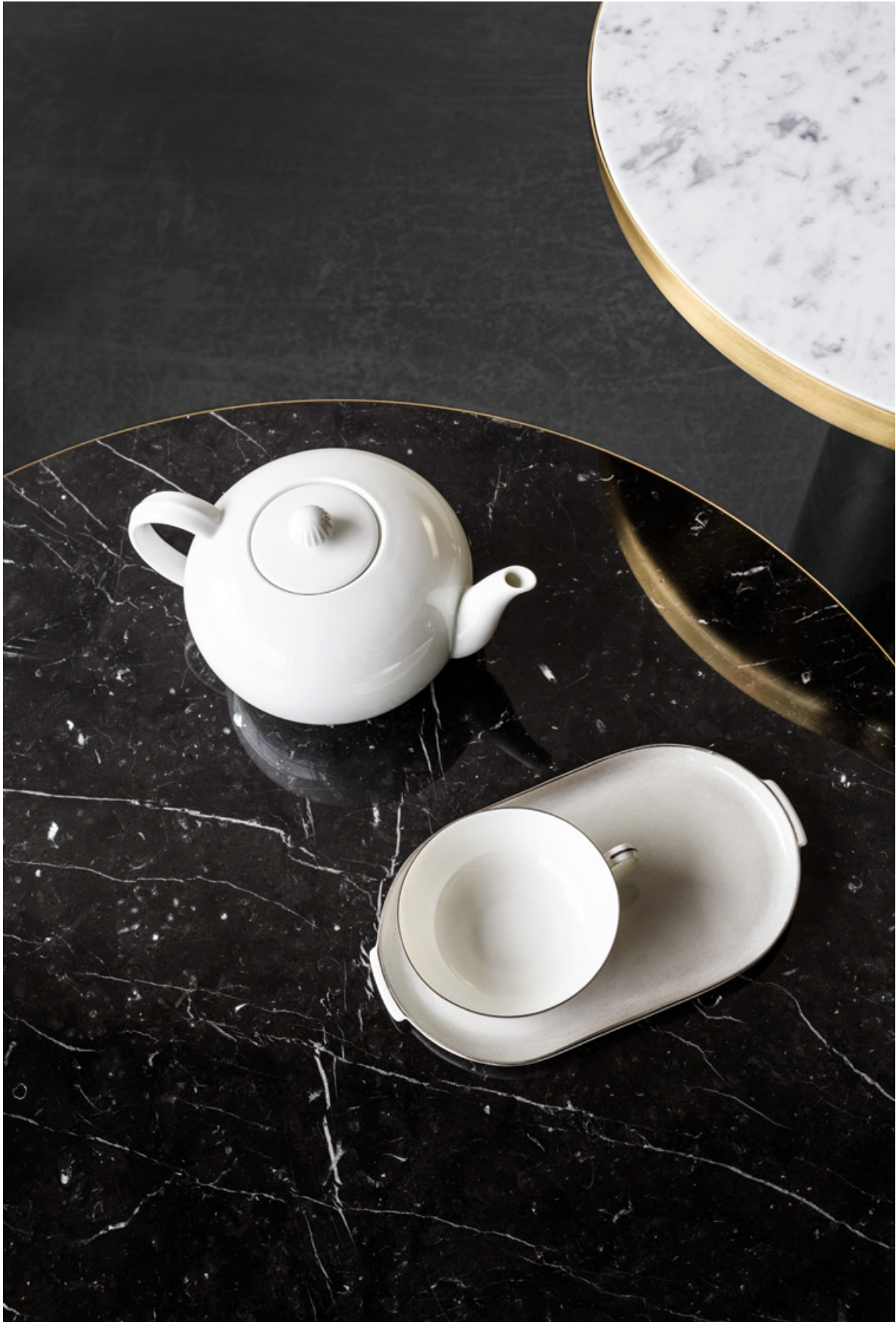
Marmor Marble Nero Marquina & Bianco Carrara