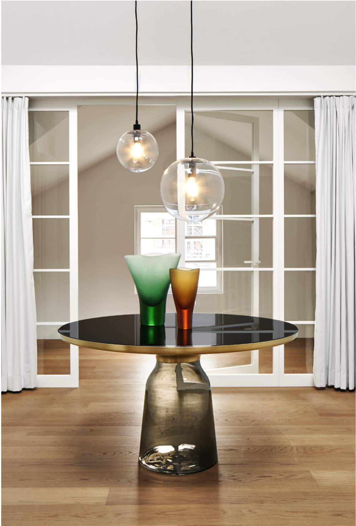
Selene Pendant Lamp