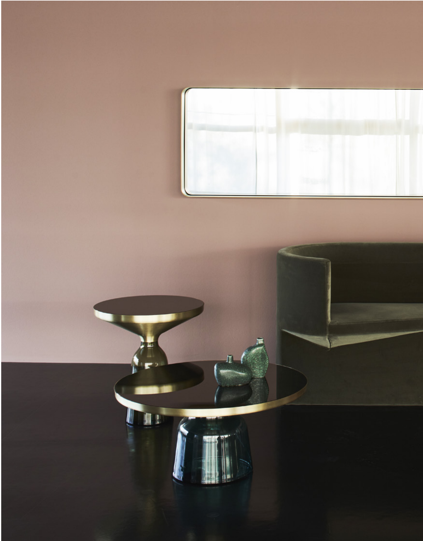
Cypris Mirror, Odin Sofa