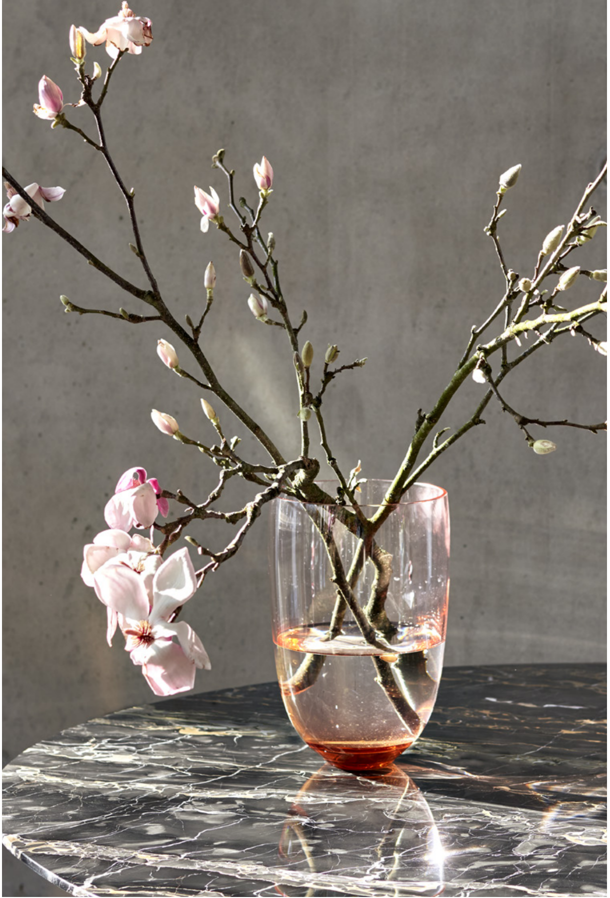
Marmor Marble Nero Portoro