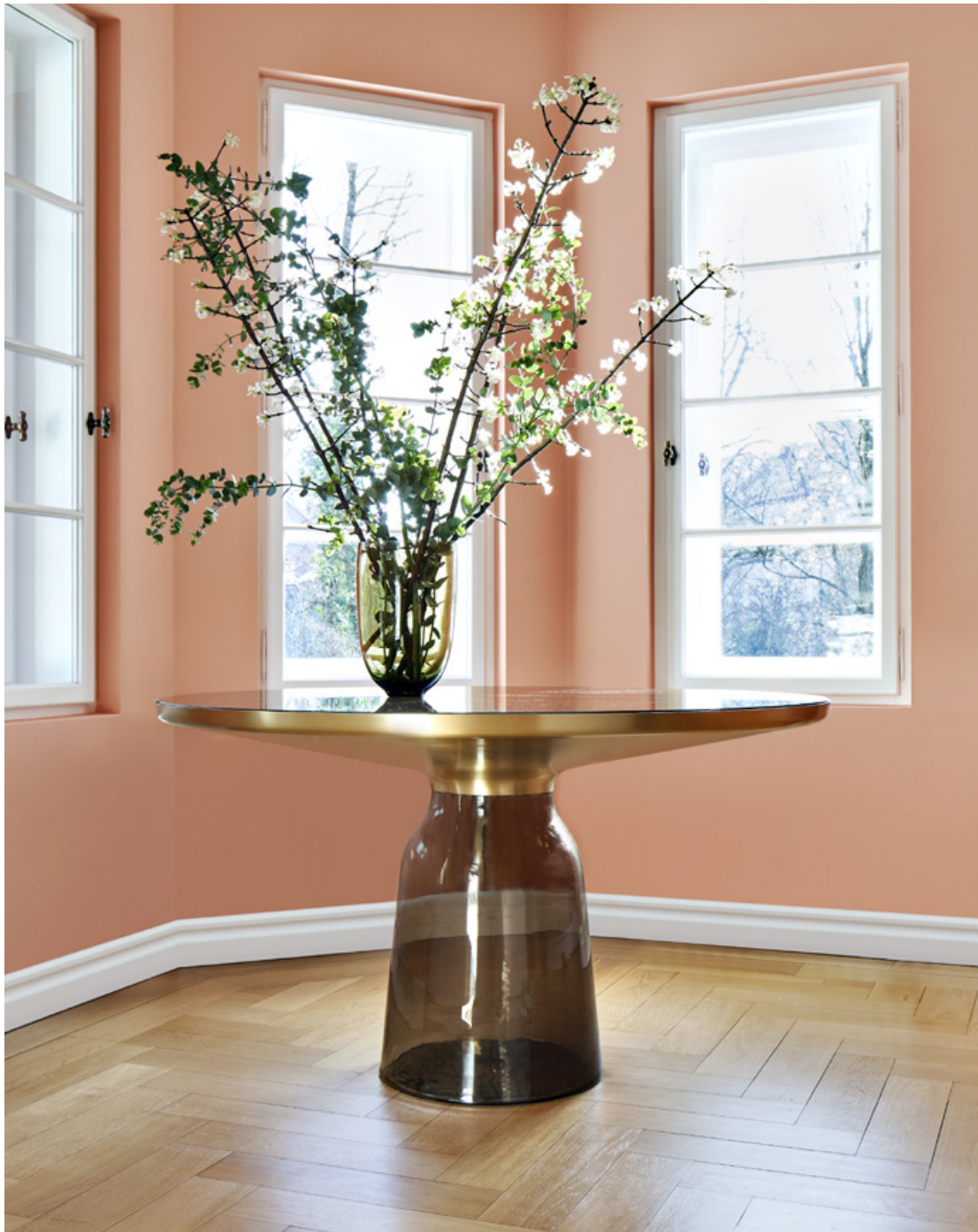
Bell High, Plissée, Bell Sapphire Blue & Shia