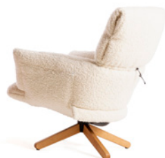
con base a 4 razze in legno / with 4-spoke wooden base