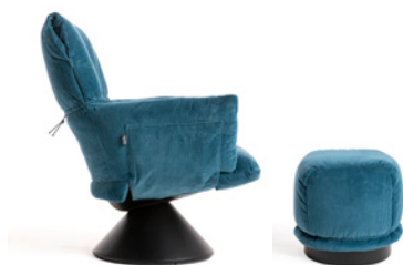
con base conica e pouf / with conical base and ottoman

A relaxing armchair characterized by great innovation, both for its shape and its manufacturing system. A structure made of recycled plastic material hosts a soft dress, available in different fabrics or leathers. With a simple gesture, one can remove the entire padded upholstery, giving Lud'o an ever-changing look. Not an armchair with a removable cover, but an armchair with a removable dress, marked out by great comfort. An immediate and highly recognizable image makes this product an important chapter in contemporary seating evolution.