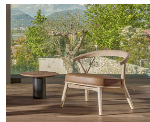
NEWOOD RELAX LIGHT