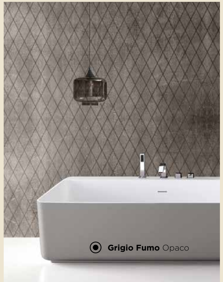
Grigio Fumo Opaco

Il lavabo Tulip standard, la vasca e il lavabo monolita possono essere laccati esternamente nei colori Arblu, andando così a soddisfare a pieno le esigenze del cliente.